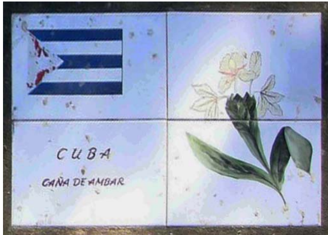
Fig. 2. Placa que se conserva en el Jardín de La Paz (Mar del Plata, Argentina), donde aparece el nombre de Cuba, el nombre y la imagen de su Flor Nacional y la bandera cubana. (Nota: Según Pereda & al. (1992), la mariposa es conocida como "caña de ámbar" en otros países).

El Jardín de La Paz está conformado por las Flores Nacionales de cada país con representación diplomática en Argentina. Junto a cada planta, hay una placa con el nombre del país, de la flor y su imagen y al lado, la bandera nacional respectiva (Figura 2).